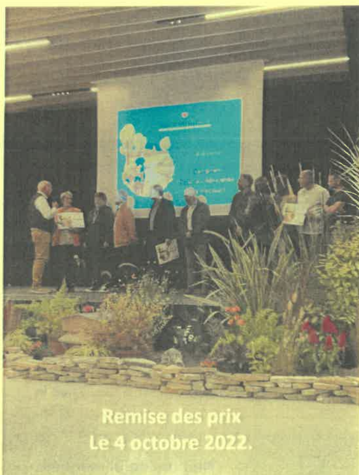
Remise des prix Le 4 octobre 2022.