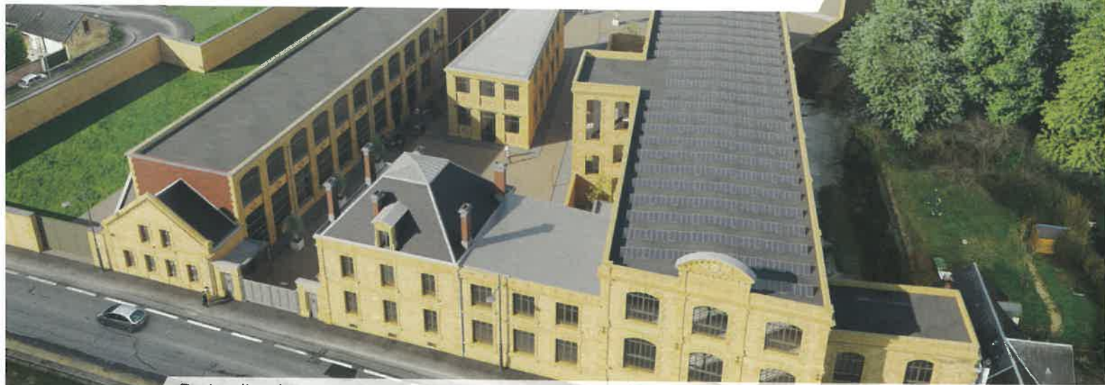
Projet d'aménagement de la Macérienne, actuellement en phase de dépollution des sols - © Ask Conception