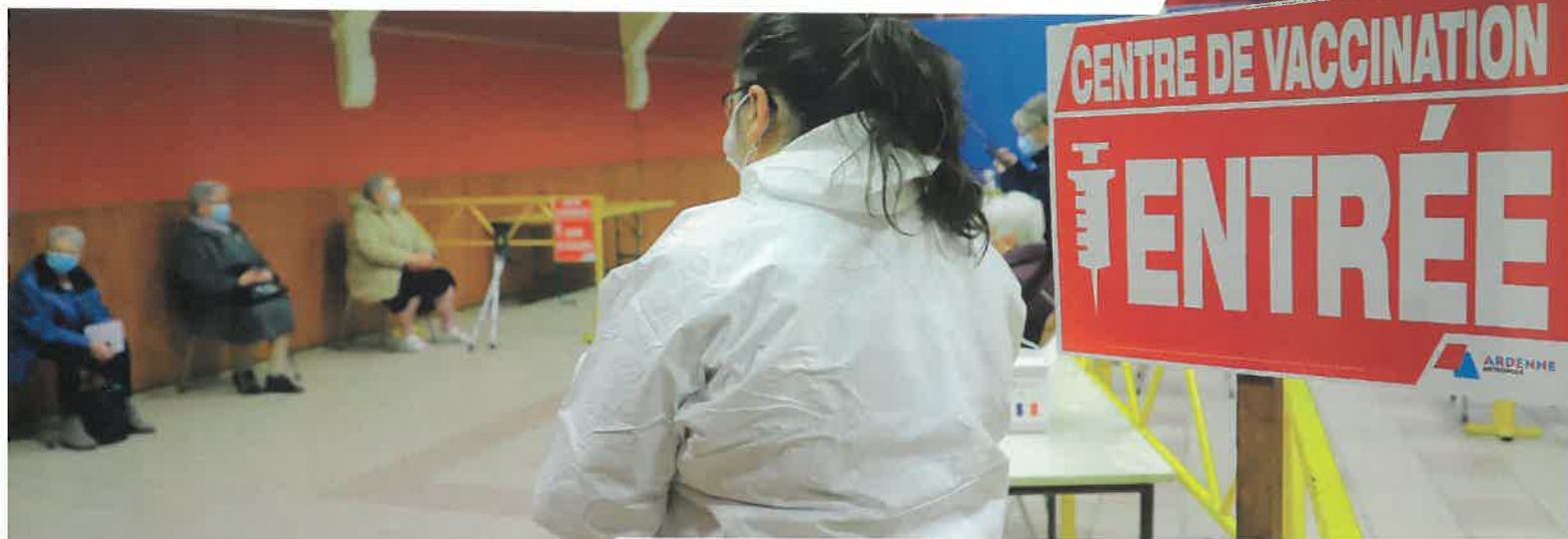
Le centre de vaccination ouvert à Vrigne-aux-Bois depuis le 19 janvier 2021