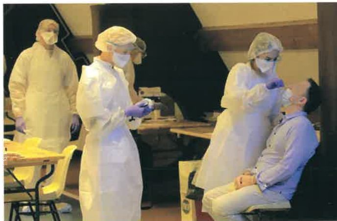
23.521 personnes testées dans les 8 centres du territoire entre le 14 et le 30 décembre

(des chambres d'hôtel avaient même été prévues pour l'occasion), d'autres non. Mais dans tous les cas, ces 1.241 porteurs du virus, désormais avertis de leur état, ont modifié leur comportement durant cette période cruciale des fêtes, évitant ainsi un désastreux effet boule de neige : loin de voir l'épidémie s'emballer, les Ardennes, tout en restant dans le rouge, ont retrouvé en janvier un niveau de diffusion de la covid-19 moins angoissant.