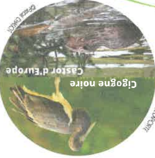
Cigogne noire Castor d'Europe