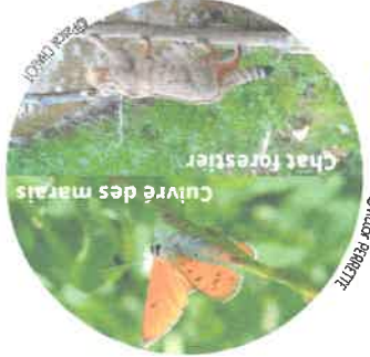
Chat forestier Cuirvé des marais