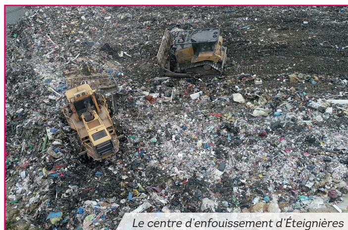
Le centre d'enfouissement d'Éteignières

Sans même parler de l'aspect purement environnemental, cette impressionnante accumulation est devenue ces dernières années très pesante pour les finances des collectivités en charge de la collecte et du traitement des déchets. Les déchets en question sont en effet taxés par l'État via la TGAP (Taxe générale sur les activités polluantes). Or l'État a décidé de quadrupler cette taxe, la faisant passer de 17 à 65 euros la tonne.